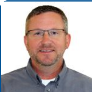
Par Jeff Gunn, M. Sc.

Quel est le message à retenir? Il est plus facile de gérer ce que l'on mesure. Chaque fois que vous apportez des changements, prenez-les en note; utilisez vos données (de Lactanet, de votre logiciel à la ferme ou de votre système de traite automatisée); et contactez votre équipe de conseillers agricoles pour vous aider à interpréter ces renseignements extrêmement utiles. Beaucoup de producteurs le font, et ils voient des résultats.