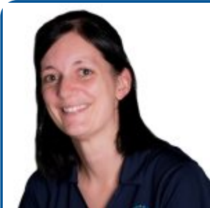
Par Débora Santschi, agr., Ph. D.

Ce projet est financé par l'entremise du programme Innov'Action agroalimentaire, en vertu du Partenariat canadien pour l'agriculture, entente conclue entre les gouvernements du Canada et du Québec.