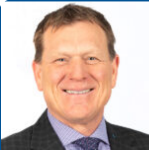
Par Brian Van Doormaal

Hannah a découvert sa passion pour l'agriculture pendant ses études de premier cycle à l'Université de Guelph et grâce à son expérience professionnelle dans l'industrie laitière. Elle est titulaire d'un B.Sc. en biologie moléculaire et génétique ainsi qu'un doctorat en génétique animale axé sur l'amélioration génétique de la fertilité des bovins laitiers.