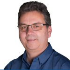
Par Mario Séguin agr.

équipe. En tant qu'expert en production laitière - robots de traite, il contribue activement comme expert conseil et auteur à l'avancement de l'industrie de la production laitière.