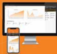
Balance W-O et Application de performance animale.

Nouveau. Plus qu'un mot, c'est le concept qui nous propulse.