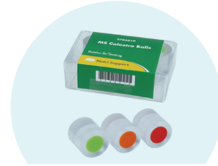
COLOSTROBALLS (Marca comercial)

Calostro a 20 °C al momento de la prueba